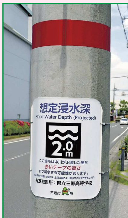
電柱に設置された標識と想定浸水深を示すテープ(三郷市で)

A 国土交通省 利根川上流河川事務所が設置していたものです。 この事業は、利根川上流河川事務所から令和元年度をもって廃止する旨、市に連絡があったものであり、その撤去が最近になって行われたものと認識しています。 本市では、4月に新たな洪水ハザードマップを配布しましたが、お住いの地域がどの程度浸水するのかをご理解いただくため、カスリーン台風のような過去の水害の記録ではなく、その地区で想定されるか寸氾濫時の浸水の深さをお知らせするよう、段階的な設置について検討を進めているところです。